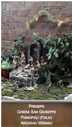
PRESEPE CHIESA SAN GIUSEPPE PIANOPOLI (ITALIA)