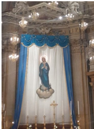
MARIA SS. IMMACOLATA BASILICA DEI SANTI XII APOSTOLI ROMA (ITALIA)