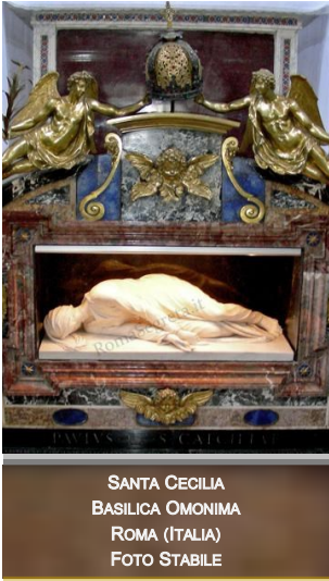
SANTA CECILIA BASILICA OMONIMA ROMA (ITALIA) FOTO STABILE

Avvento significa venuta. Questa parola fa riferimento innanzi tutto al Natale di Gesù, alla venuta in mezzo agli uomini del Figlio di Dio. Ma Gesù non è soltanto colui che è venuto, egli è anche colui che viene e che verrà.