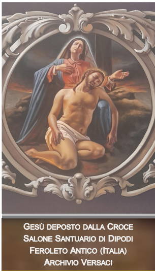
GESÙ DEPOSTO DALLA CROCE SALONE SANTUARIO DI DIPODI FEROLETO ANTICO (ITALIA)

Per il nostro Signore Gesù Cristo, tuo Figlio, che è Dio, e vive e regna con te, nell'unità dello Spirito Santo, per tutti i secoli dei secoli. A - Amen.