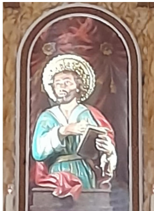
SANT'ANDREA APOSTOLO CHIESA OMONIMA MAIDA (ITALIA)