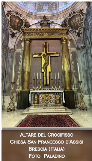
ALTARE DEL CROCFISSO CHIESA SAN FRANCESCO D'ASSISI BRESCIA (ITALIA)