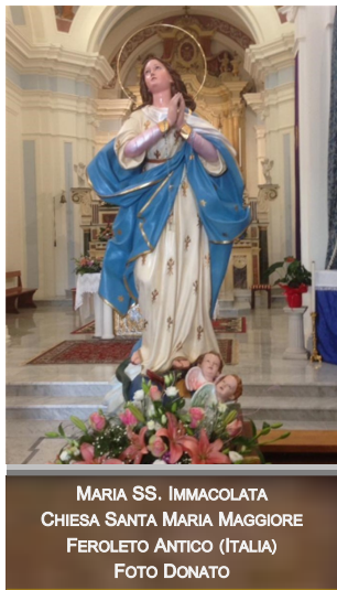
MARIA SS. IMMACOLATA CHIESA SANTA MARIA MAGGIORE FEROLETO ANTICO (ITALIA)