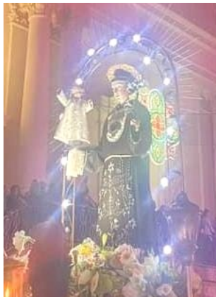
SANT'ANTONIO DA PADOVA PARROCCHIA S. MARIA DEGLI ANGELI LAMEZIA TERME (ITALIA)