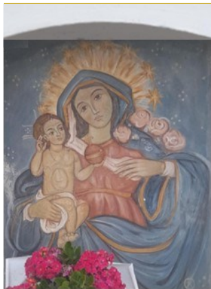
MARIA SANTISSIMA DE PURIS EDICOLA CONTRADA DIPODI FEROLETO ANTICO (ITALIA)